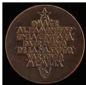
Rewers medalu z Ludwikiem Zamenhofem