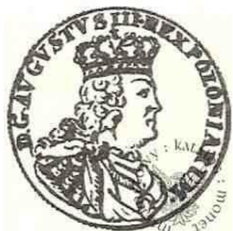
Tymf Augusta III Sasa – awers monety