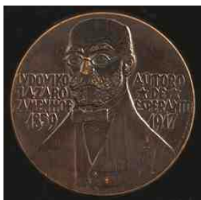
Awers medalu z Ludwikiem Zamenhofem

Rewers – strona odwrotna monety, medalu itp., zawierająca treści uzupełniające.