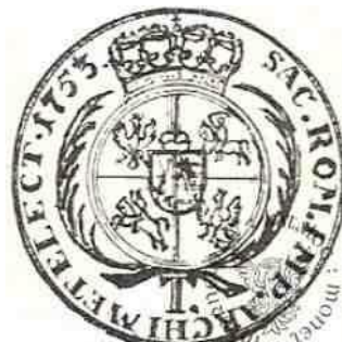
Tymf Augusta III Sasa – rewers monety

Wynalazek – rzecz nowa lub udoskonalona, stworzona (skonstruowana) przez człowieka, np. koło.